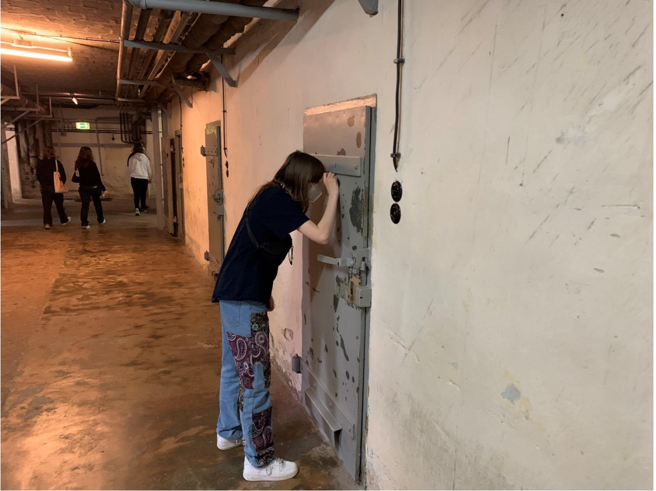
STASI-fængslet i Hohenschönhausen - her er vi nede i "das U-boot"