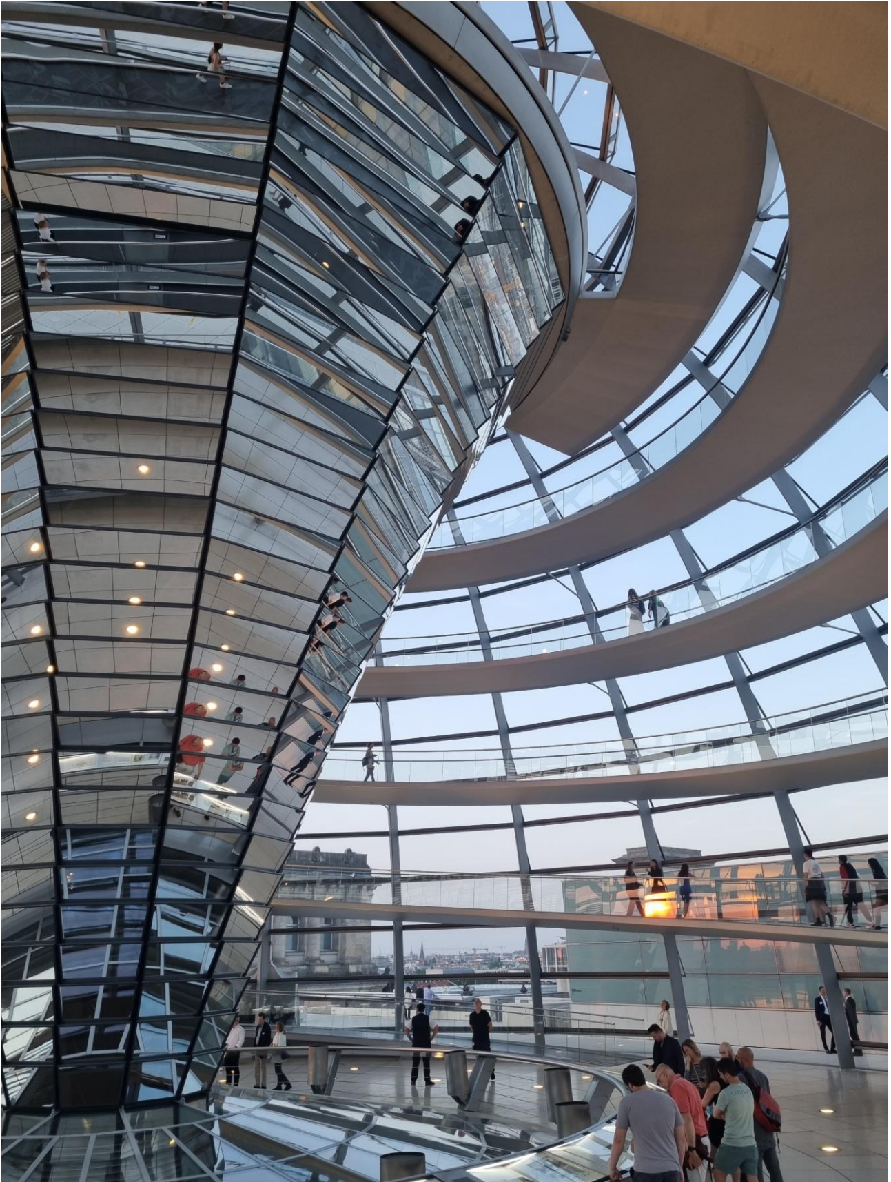
Den store kuppel på taget af den gamle Rigsdagsbygning er imponerende - og ligeså er udsigten