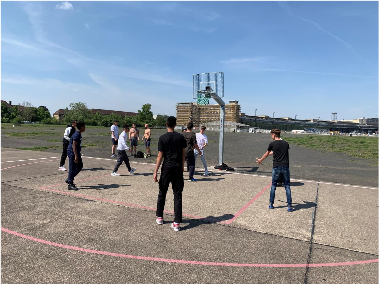
På det tidligere lufthavnsområde (Flughafen Berlin-Tempelhof) blev spillet bold på en af landingsbanerne