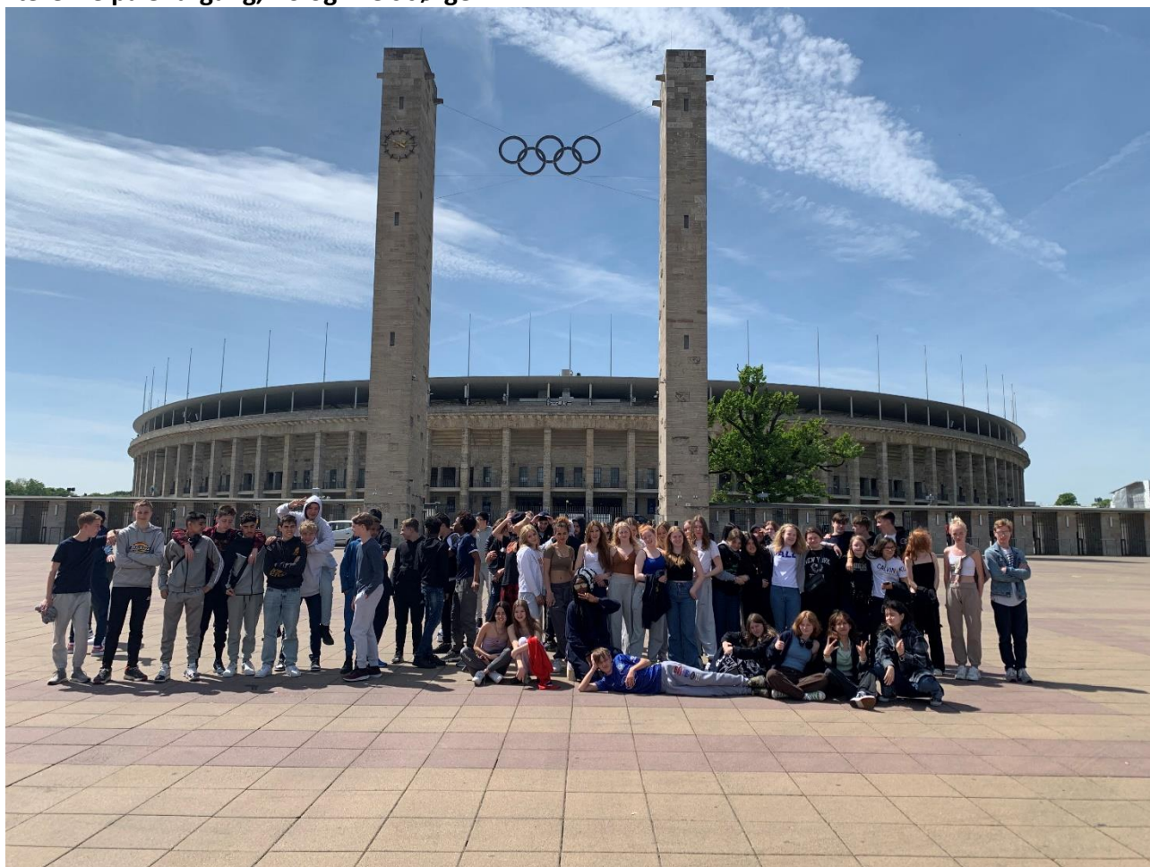
Olympiastadion (1936) og Herthas hjemmebane