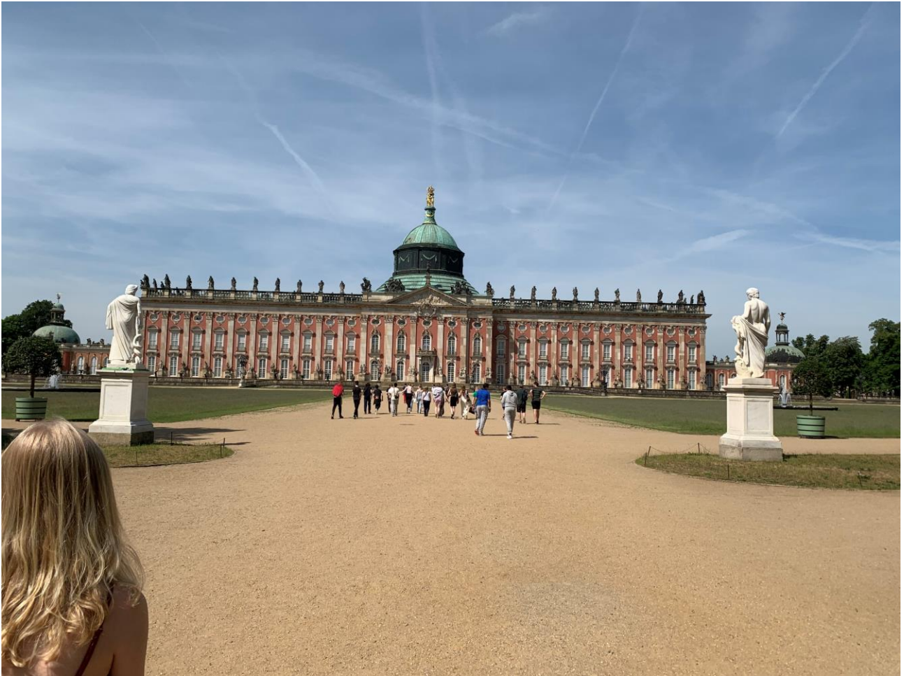
Neues Palais. - Frederik den Stores imponerende gæstehus. Her boede kejser Wilhelm 2. - den sidste tyske kejser en stor del af tiden.