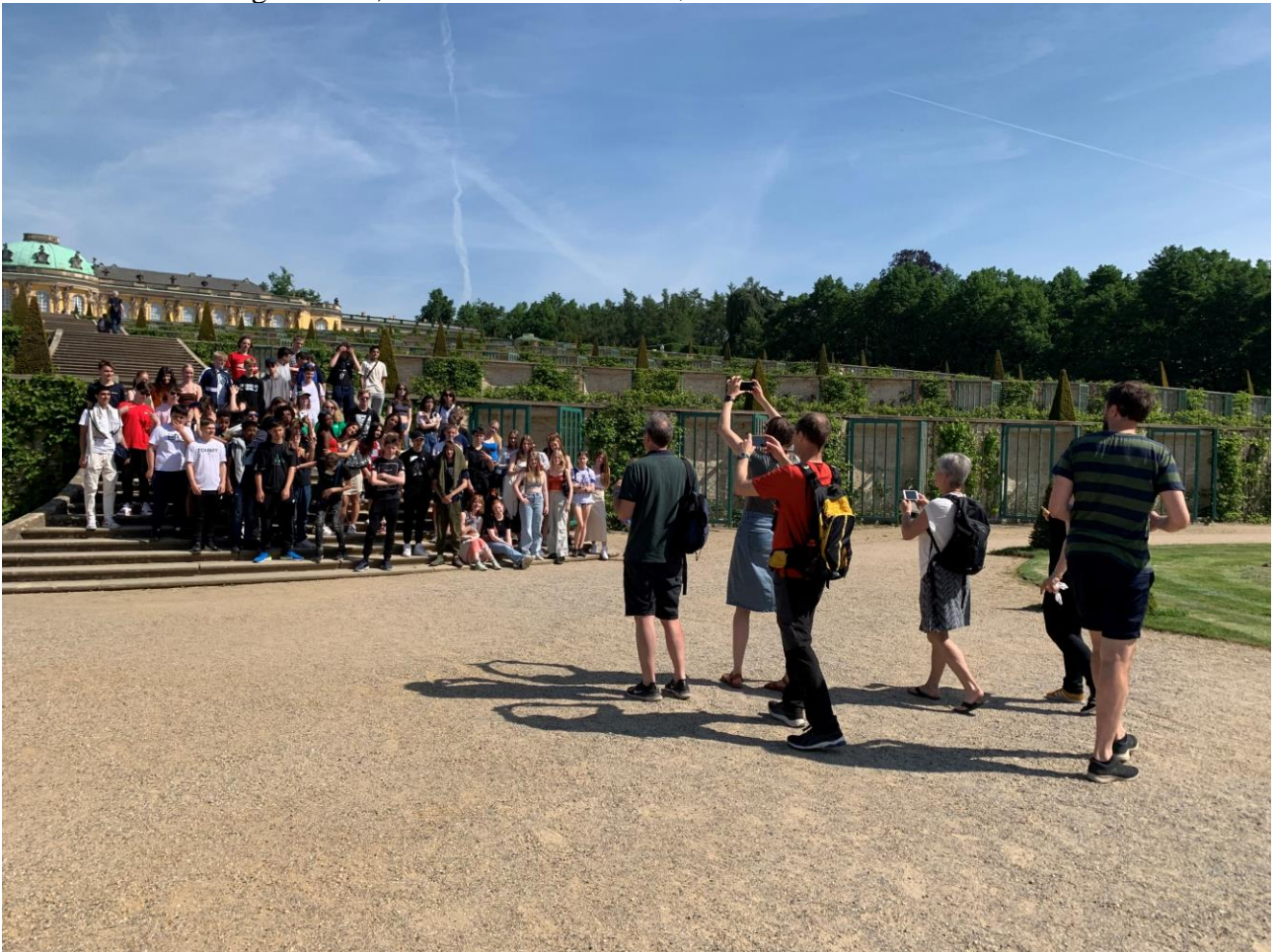
8.klasserne foran Frederiks den Stores vin- og figenterrasser

Frederik den Stores grav uden for sit bibliotek på Sanssouci - og så en masse kartofler. Kartofflerne forbindes med en legende om, at det var ham der indførte dem i Preussen.