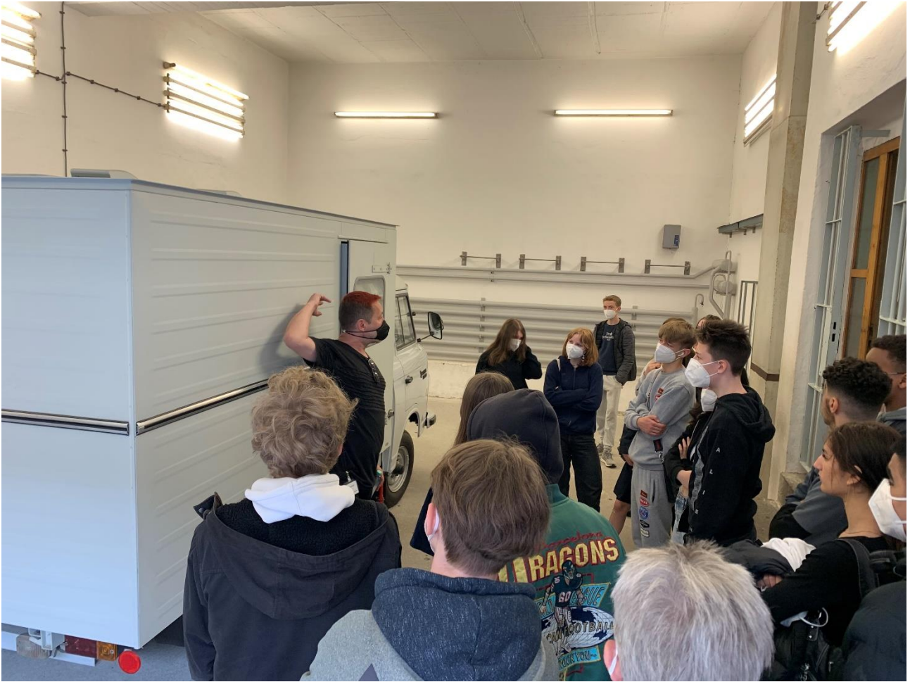
I Hohenschönhausen hørte vi bl.a. om transport af fanger i ret så specielle biler